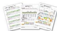
データをレポート化