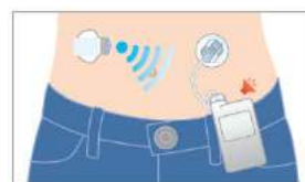
音やバイブでお知らせするアラート機能を搭載

更に、インスリンポンプが持つ情報は、専用の管理ソフトを介して統合的に解析され、データのレポート化により個々の患者さまごとの最適な治療方針を導く情報として医師に提供させることが出来ます。インスリンポンプ療法を使用していない患者さまへは、CGMのみの検査を行うことが可能です。※1、※2